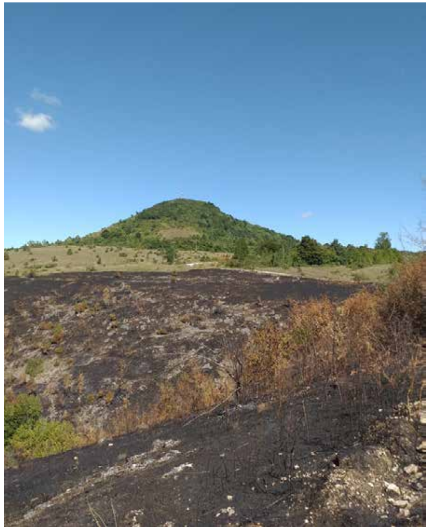
Брдо Виторога, које представља заштитни знак Подгрмеча, на шта су Миљевчани посебно поносни јер наткриљује њихово село. Ово брдо има велики историјски значај, јер је у свим ослободилачко-отаџбинским ратовима представљало одбрамбени бедем. Ту су успостављани први устанички фронтови да би се спрјечио продор непријатеља на подгрмечку слободну територију. Због таквог геостратешког положаја историчари су Виторогу назвали “ВРАТА ПОДГРМЕЧА”.

Кола су се управо приближавала одредишту, кад се иза кри-